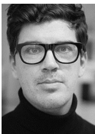
圖二：史蒂芬·施洛普夏爾