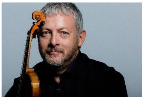
圖三：香港管弦樂團法比奧·比昂迪