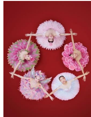
圖二十一：《胡桃夾子》宣傳圖片 | 舞蹈員(由上·順時針起)：葉飛飛、澤井玲奈、高歌、班納特、張雪寧 | 圖片創作：Design Army | 攝影：Ken Ngan | 圖片由香港芭蕾舞團提供