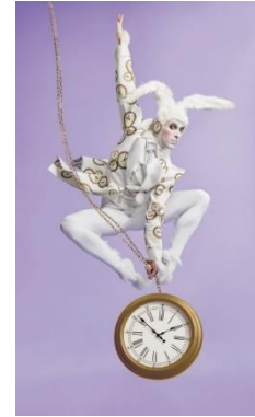
圖十二：《愛麗絲夢遊仙境》宣傳圖 片 | 舞蹈員：尊尼芬·斯納 | 圖片創 作：Design Army