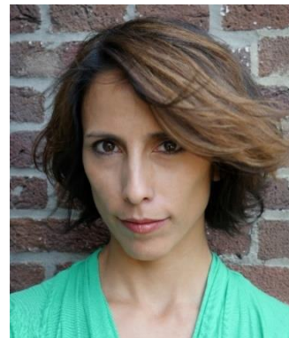
圖三十九：編舞奧喬亞