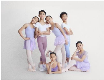
圖三十四：「港芭 | 工作坊」宣傳圖片 | 兒童舞蹈員 | 圖片創作：Design Army