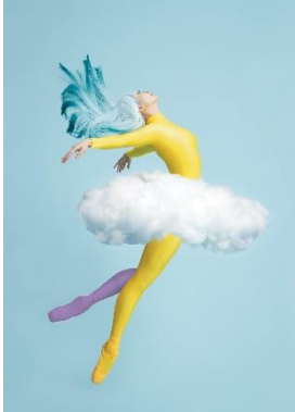
圖一：舞蹈員：葉飛飛 | 圖片創作：Design Army | 攝影：Ken Ngan | 圖片由香港芭蕾舞團提供