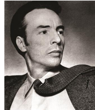
圖三十六：編舞喬治·巴蘭欽