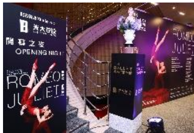
圖五十三：中國光大控股有限公司榮譽呈獻《羅密歐+茱麗葉》場地