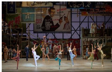
圖二十九：中國光大控股有限公司榮譽呈獻《羅密歐+茱麗葉》| 香港芭蕾舞團舞蹈員