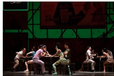
圖三十：中國光大控股有限公司榮譽呈獻《羅密歐+茱麗葉》| 香港芭蕾舞團舞蹈員