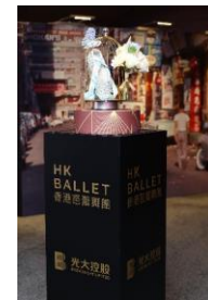
圖五十四：中國光大控股有限公司榮譽呈獻《羅密歐+茱麗葉》場地