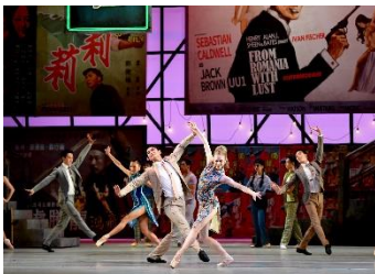
圖二十八：中國光大控股有限公司榮譽呈獻《羅密歐+茱麗葉》| 香港芭蕾舞團舞蹈員