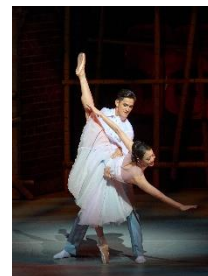
圖九：中國光大控股有限公司榮譽呈獻《羅密歐+茱麗葉》| 香港芭蕾舞團舞蹈員