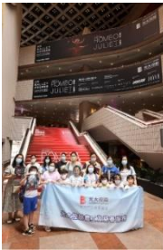
圖四十九：共融基金受惠家庭——香港青少年服務處賽馬會方樹泉綜合青少年服務中心 | 圖片由香港芭蕾舞團提供