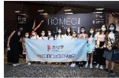
圖五十一：共融基金受惠家庭——香港遊樂場協會旺角青少年綜合服務中心