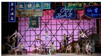
圖二：中國光大控股有限公司榮譽呈獻《羅密歐 + 茱麗葉》| 香港芭蕾舞團舞蹈員