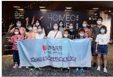
圖五十：共融基金受惠家庭——香港小童群益會賽馬會長沙灣青少年綜合服務中心