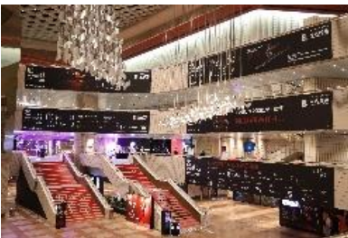
圖五十二：中國光大控股有限公司榮譽呈獻《羅密歐+茱麗葉》場地