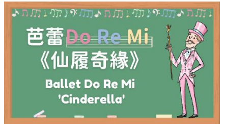
圖三十：「盡演（芭蕾）藝術節」：「港芭教室：芭蕾 Do Re Mi——《仙履奇緣》」