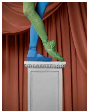
圖三十二：「盡演（芭蕾）藝術節」宣傳圖片 | 舞蹈員：班納特 | 攝影：SWKit | 圖片由香港芭蕾舞團提供