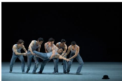
圖五：「盡演（芭蕾）藝術節」《六人五作》之《極端黑暗》| 香港芭蕾舞團舞蹈員