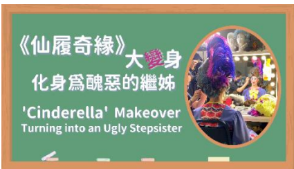
圖三十一：「盡演（芭蕾）藝術節」：「港芭教室：《仙履奇緣》大變身——化身為醜陋的繼姊」| 圖片由香港芭蕾舞團提供