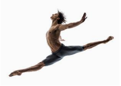
圖十：客席首席藝術家丹尼爾·卡馬哥