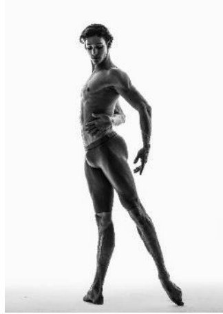
圖十一：客席首席藝術家丹尼爾·卡馬哥