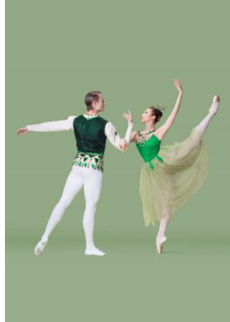
圖五：Van Cleef & Arpels 梵克雅寶榮譽呈獻《巴蘭欽〈珠寶〉》宣傳圖片 | 舞蹈員 (左起)：余爾頓、楊睿琦 | 攝影：SWKit | 圖片由香港芭蕾舞團提供